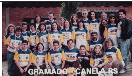
GRAMADO - CANELA - RS 39ª REUNIÃO PLENÁRIA DE ORBIS INTERNACIONAL - VÁRZEA GRANDE/RS De 30 de julho a 02 de agosto de 1997