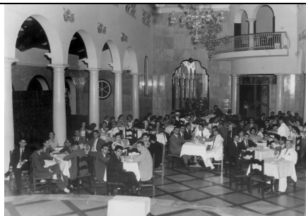
2ª REUNIÃO PLENÁRIA DE ORBIS INTERNACIONAL - BELÉM/PA - 1959