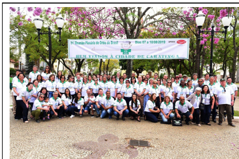
61ª REUNIÃO PLENÁRIA DE ORBIS DO BRASIL – CARATINGA/MG De 07 a 10 Agosto de 2019