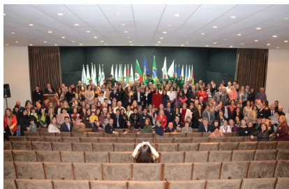
55ª REUNIÃO PLENÁRIA DE ORBIS DO BRASIL - GRAMADO/RS De 31 de Julho a 03 de agosto de 2013