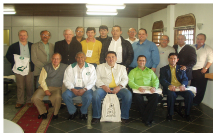
47ª REUNIÃO PLENÁRIA DE ORBIS DO BRASIL – GRAMADO/RS DE 26 a 29 de julho de 2005