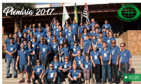
59ª REUNIÃO PLENÁRIA DE ORBIS DO BRASIL - LINS/SP De 26 a 28 Julho de 2017