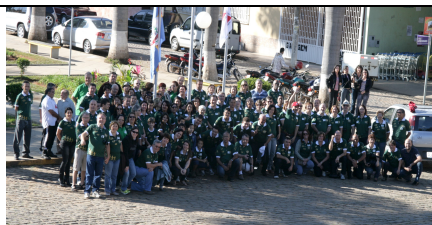
54ª REUNIÃO PLENÁRIA DE ORBIS DO BRASIL - TEIXEIRAS/MG De 25 a 28 de julho de 2012