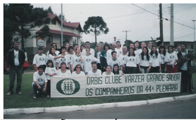
44ª REUNIÃO PLENÁRIA DE ORBIS DO BRASIL - VARZEA GRANDE/RS DE 31 de Julho a 03 de agosto de 2002