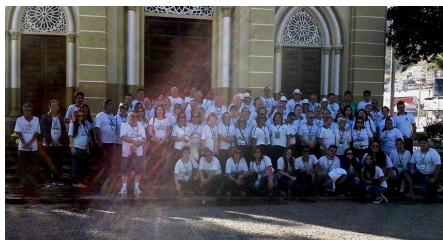
57ª REUNIÃO PLENÁRIA DE ORBIS DO BRASIL - CARATINGA/MG De 22 a 25 de julho de 2015