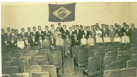
7ª REUNIÃO PLENÁRIA DE ORBIS INTERNACIONAL - SANTOS/SP JULHO DE 1964