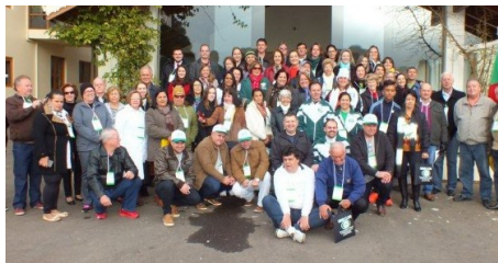
58ª REUNIÃO PLENÁRIA DE ORBIS DO BRASIL - VÁRZEA GRANDE/RS De 27 a 29 de Julho de 2016