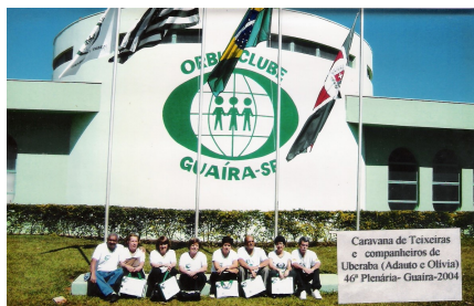
46ª REUNIÃO PLENÁRIA DE ORBIS DO BRASIL – GUAÍRA/SP DE 28 a 31 de julho de 2004