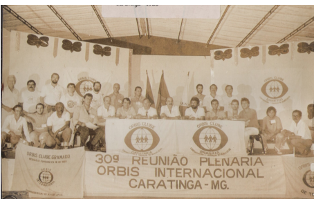
30ª REUNIÃO PLENÁRIA DE ORBIS INTERNACIONAL - CARATINGA/MG De 20 a 23 de JULHO de 1988