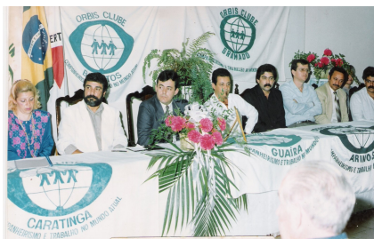
33ª REUNIÃO PLENÁRIA DE ORBIS INTERNACIONAL - TEIXEIRAS/MG De 18 a 20 de julho de 1991