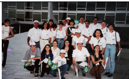
41ª REUNIÃO PLENÁRIA DE ORBIS DO BRASIL – BRASÍLIA/DF De 07 a 10 de julho de 1999