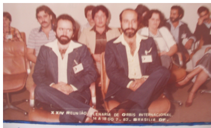
24ª REUNIÃO PLENÁRIA DE ORBIS INTERNACIONAL - BRASÍLIA/DF DE 14 A 18 DE JULHO DE 1982