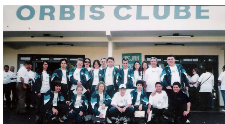
43ª REUNIÃO PLENÁRIA DE ORBIS DO BRASIL – BARRETOS/SP De 18 a 20 de Julho de 2001