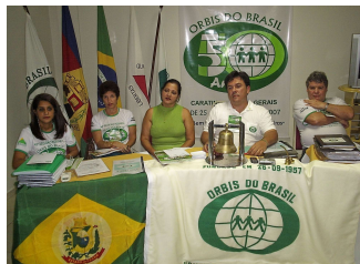
49ª REUNIÃO PLENÁRIA DE ORBIS DO BRASIL – CARATINGA/MG DE 25 a 28 de julho de 2007