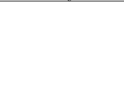
64ª REUNIÃO PLENÁRIA DE ORBIS DO BRASIL – GUAÍRA/SP De 07 a 10 de Agosto de 2024