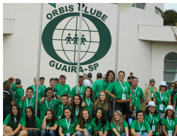
56ª REUNIÃO PLENÁRIA DE ORBIS DO BRASIL - GUAÍRA/SP De 23 a 27 de Julho de 2014