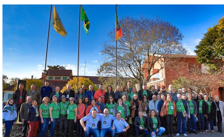
60ª REUNIÃO PLENÁRIA DE ORBIS DO BRASIL - CANELA/RS De 01 a 04 de Agosto de 2018