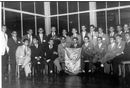
1ª REUNIÃO PLENÁRIA DE ORBIS INTERNACIONAL - SÃO LUIZ/MA - 1958