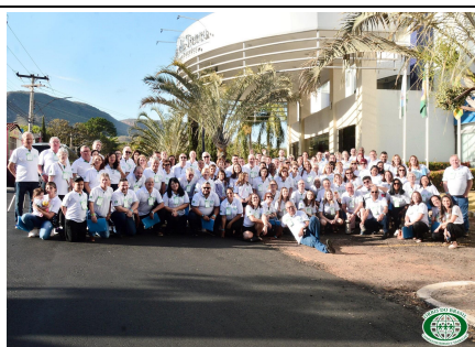
62ª REUNIÃO PLENÁRIA DE ORBIS DO BRASIL – RIO QUENTE/GO De 03 a 06 de Agosto de 2022