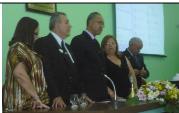
53ª REUNIÃO PLENÁRIA DE ORBIS DO BRASIL - BARRETOS/SP De 20 a 23 de julho de 2011