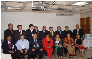
48ª PLENÁRIA DE ORBIS DO BRASIL UBERABA/MG DE 25 a 28 de julho de 2006